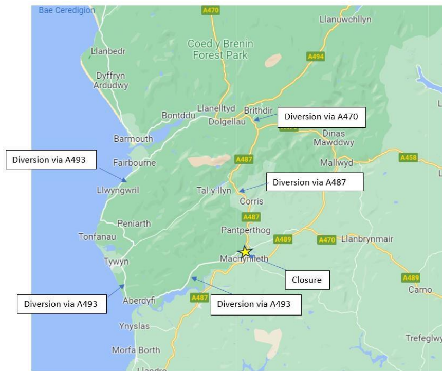
Proposed Diversion Route (A493 Closure Machynlleth)

Bydd y llwybrau gwriad ag arwyddion hyn ar waith pan fydd y ffordd wedi cau: